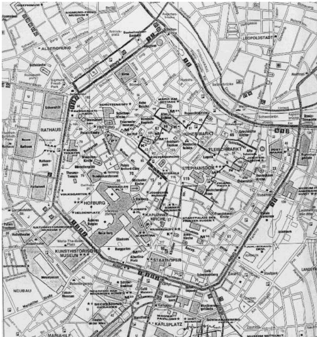
Guide Vert, Vienne, Éditions des Voyages, 286 pages, page 6

Par ailleurs, le développement de nouvelles stratifications sociales entraîne l'apparition d'un habitat ouvrier dans les anciens faubourgs de la capitale.